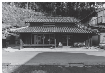
宿泊・食事・喫茶 奥松阪