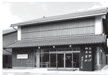
豪商のまち松阪 観光交流センター